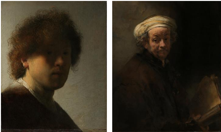
Zelfportret op jeugdige leeftijd, Rembrandt, 1628-1629