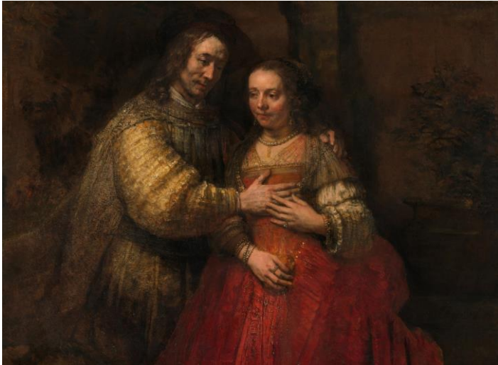
Portret van een paar als oudtestamentische figuren, genaamd 'Het Joodse bruidje', Rembrandt, 1665-1669

Dit is een beroemd schilderij van Rembrandt: het Joodse bruidje.